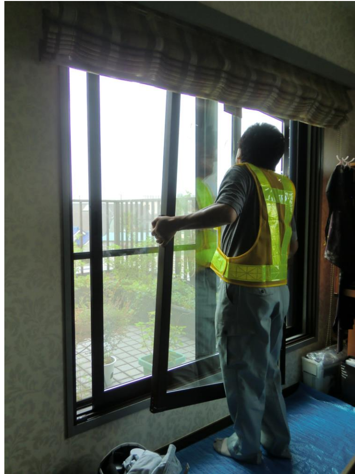
内窓のガラス障子の建て込み