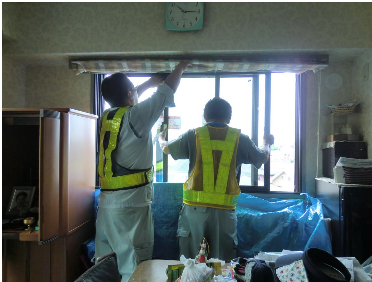
内窓のガラス障子の建て込み