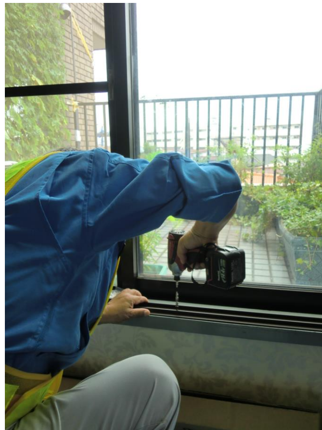
内窓外枠の取り付け